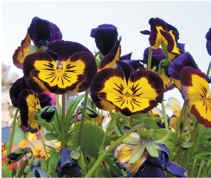
美しい花々が咲き、とても過ごしやすい暖かな季節ですね。 院内の鉢植えや展望庭園にも次々と新しい芽が育ち、 さんさんと太陽が新緑と花々を照らしています。