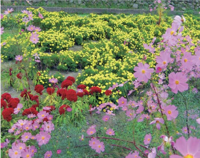
秋景色の湯野地区です。コスモス、彼岸花など自然豊かな湯野では、色鮮やかな花々が秋を彩ります。