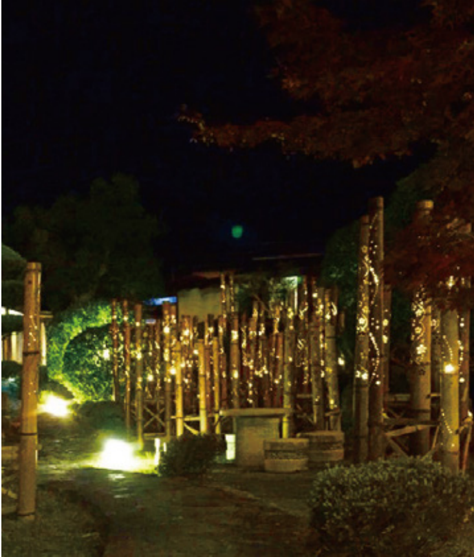
湯野のボランティアグループ「tengoo」で作製された【竹灯籠】です。 竹の中から光が灯り、とっても幻想的で綺麗でした。(場所:芳山園) 街中でもイルミネーションが始まり、師走はクリスマスや大晦日と 大きなイベントが控えていますので、ご家族やお友達など楽しい時間を過ごしましょう。