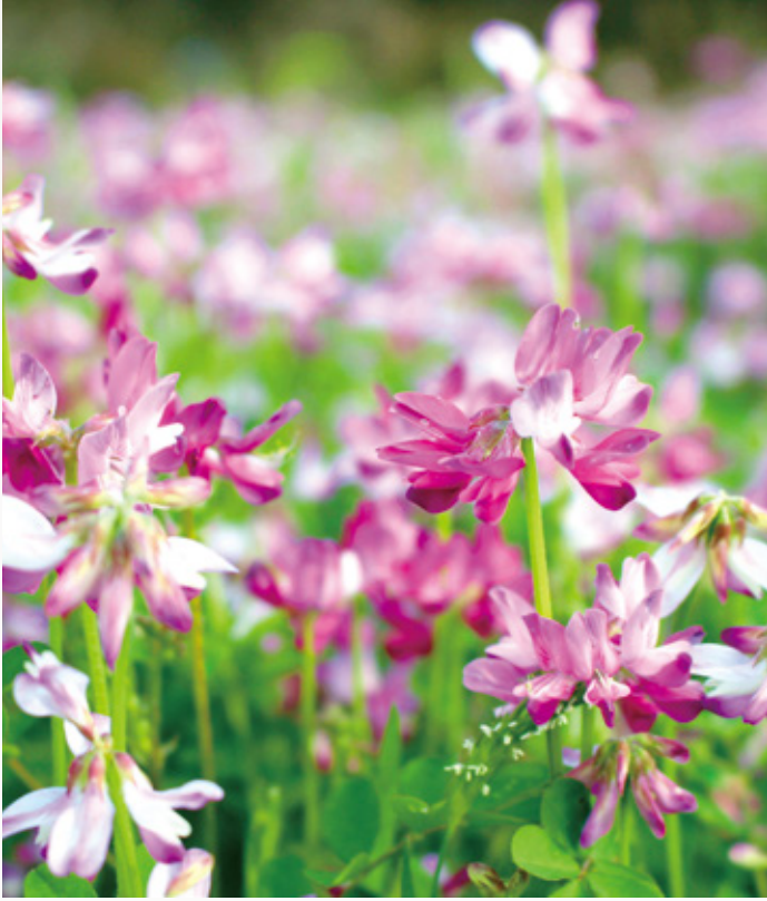
サンサンロードのそばに蓮華草が咲いていました。 展望庭園からも蓮華畑を目にすることができます。 蓮華草の花言葉は「あなたと一緒に苦痛が和らぐ」「心が和らぐ」などです。 私たちが誰かにとって「一緒にいると安心する」、そういう存在になれたらいいですね。