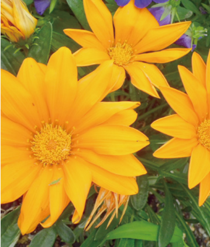
病院の展望庭園で綺麗に咲いているガザニアを見つけました。 ガザニアの花言葉は「あなたを誇りに思う」「笑顔で答える」「身近な愛」です。 「笑顔で答える」は見ている人に元気を与えてくれる花色にちなみます。 私たちがたくさんの人に元気を与えられるような人になりたいですね。