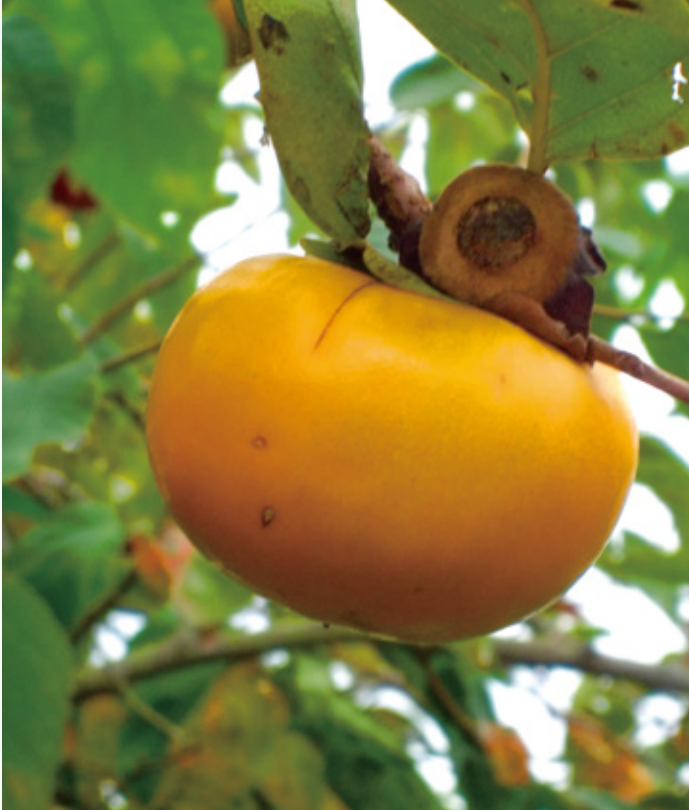
秋も深まり、朝晩寒くなってきましたね。 なごやかケア別館の側にある柿も色付いてきましたよ。 長年この柿の木を見ていますが、渋柿が甘い柿か聞いたことがないので、 いつか聞いてみようかなと思っています。